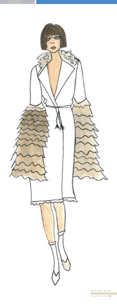
Tamina Katz Entwurf/Konzept 08